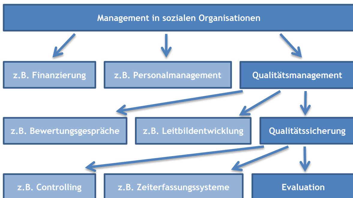
Abb.3: Evaluation im Management sozialer Organisationen

Davon ausgehend, dass mit dem Management in sozialen Organisationen alle Bemühungen gemeint sind, die darauf abzielen eine Organisation an den ständigen gesellschaftlichen Wandel, an neue strukturelle und individuelle Erfordernisse anzupassen, kann das Qualitätsmanagement einer Organisation als der Versuch verstanden werden, die Strukturen, Ablaufprozesse, Tätigkeiten und Dienstleistungen hinsichtlich ihrer Qualität zu optimieren. Dabei ist Qualitätssicherung ein wichtiges Instrumentarium, das ein Bündel an Qualitätssicherungsmaßnahmen vorhält, um Qualität greif- bzw. messbar und vergleichbar zu machen. Eine dieser Maßnahmen, mit denen Qualität erfasst und bewertet werden kann, ist die Evaluation (König 2007).